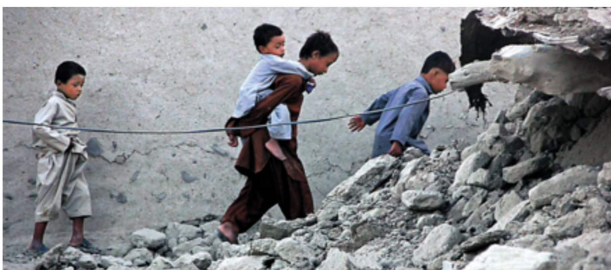
9月25日，在巴基斯坦俾路支省一处震区，生还者在废墟上行走。

当然，新陆地“拔地而起”的奇观可遇不可求。地质学家格雷厄姆说，你可别指望一场3至4级的小地震后就有“风景”可看。