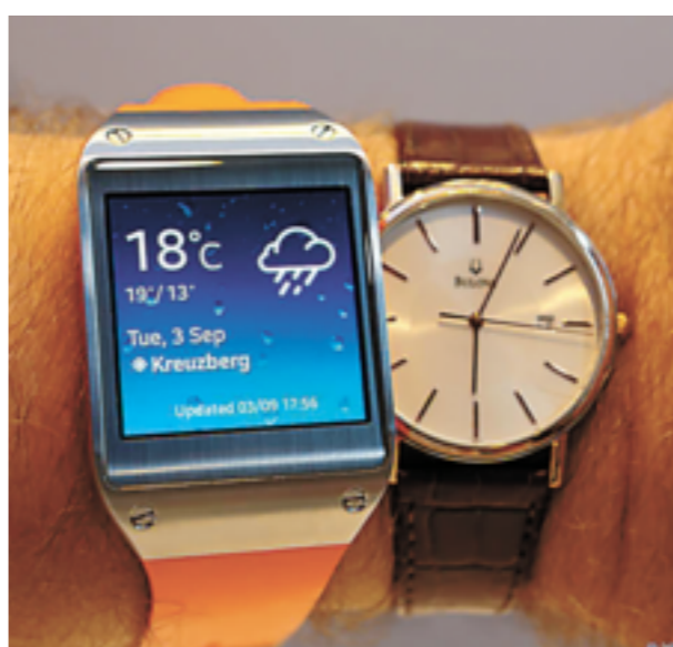
图为三星智能手表(左)与一般手表对比图。

由于使人与科技的交互更加亲密无间，可穿戴设备自问世以来就一直受到科技界的追捧，甚至被称为“引领下一场计算革命”。如果说这种“引领性”在谷歌眼镜上尚有所体现，但在智能手表上似乎还要打个问号。