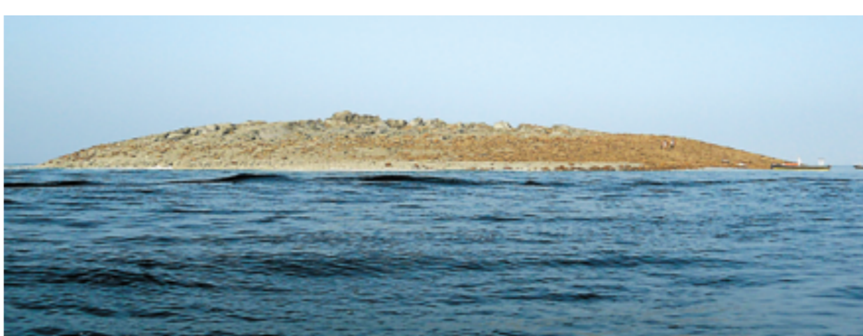
这是巴基斯坦瓜达尔海岸附近震后冒出的小岛(9月25日摄)。