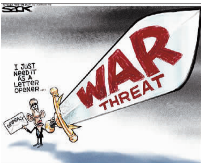
奥巴马的动武威胁“雷声大雨点小”，只是外交行动的前奏而已。