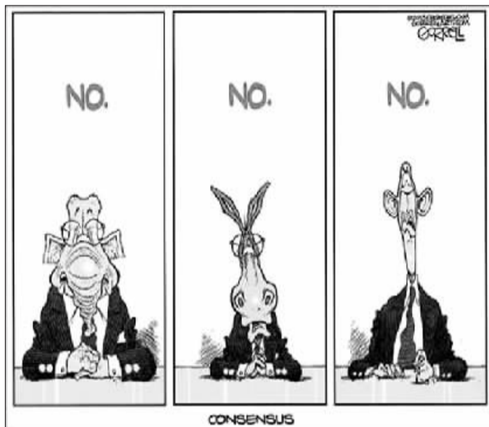
美国国会和总统唯一的一致就是说“No”。