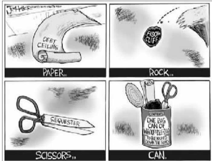
自动减支、财政悬崖、债务上限就像剪刀、石头、布。