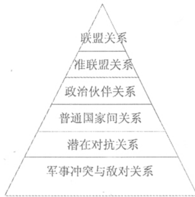
图1 国家间关系的六个层次

基于“准联盟外交”这一概念,本文将国家间关系按照国际安全合作的程度高低划分为六个等级,其中准联盟属于第二层,介于联盟与伙伴关系之间(见图1):