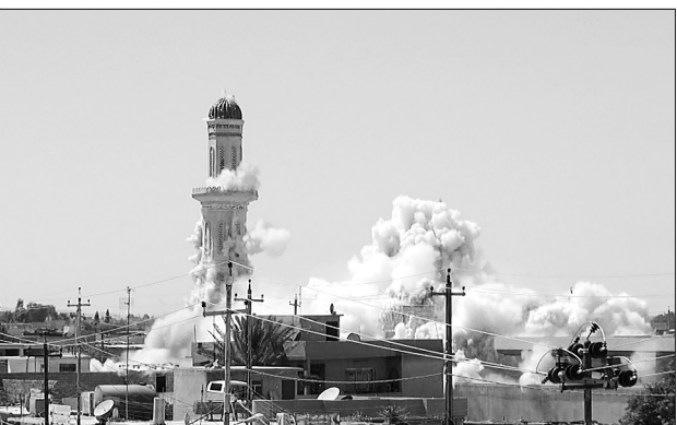
“伊黎”组织近日在其控制的摩苏尔古城与塔尔阿法范国内摧毁了至少10座神庙和清真寺。