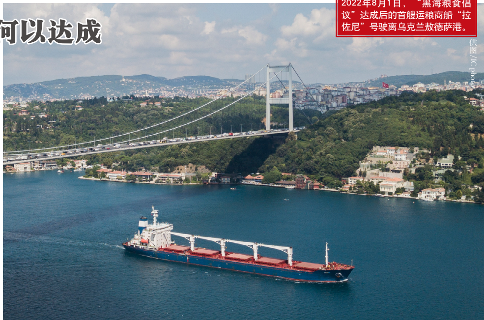
2022年8月1日，“黑海粮食倡议”达成后的首艘运粮商船“拉佐尼”号驶离乌克兰敖德萨港。

粮食安全问题不仅关乎一国民众的基本生存，而且还会对该国的政治、经济和社会生态造成系统性影响，甚至形成外溢效应并可能由此酿成地区冲突。俄罗斯与乌克兰都是全球最主要的粮食生产与出口国，此外俄罗斯