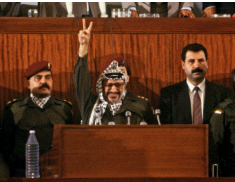
1988年11月15日，巴勒斯坦全国委员会第19次特别会议通过《独立宣言》，阿拉法特开心地举手示意胜利。

居加沙地带，随后进入开罗大学土木工程系与埃及军事学院学习。阿拉法特也参与了第四次和第五次中东战争。武装抗击以色列的同时，他秘密筹建了巴勒斯坦民族解放运动组织（法塔赫）。1959年，法塔赫正式成立。1969年，阿拉法特任法塔赫执行委员会主席。