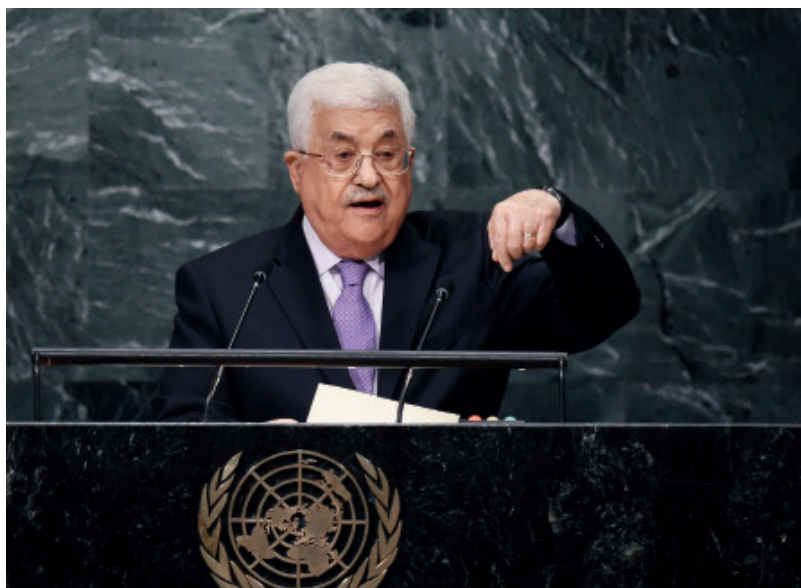
2016年9月22日，阿巴斯（左图）和内塔尼亚胡（右图）在联合国大会上分别发表言论。