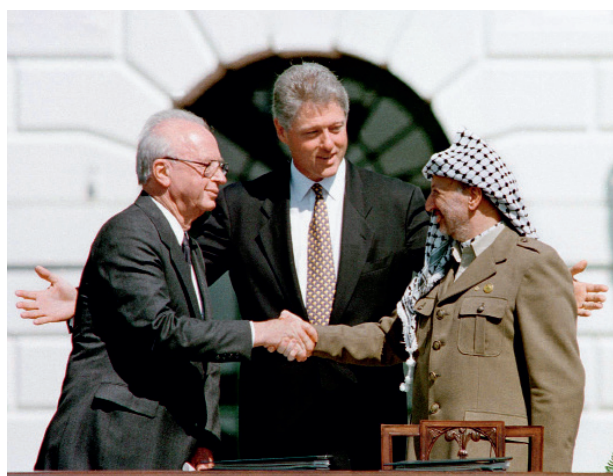
1993年9月13日，白宫前草地上，拉宾（左）与阿拉法特（右）握手，克林顿站在两人中间。

那两年，巴以关系确实得到缓和。1995年11月4日，在特拉维夫的和平集会上，拉宾发表演讲，高兴地说：“以色列人民已经证明，和平是可能的，和平打开了通往经济发展和美好生活的大门；和平是犹太人民的强烈愿望、真诚愿望。”但几个小时后，惨剧发生。一名持极端保守立