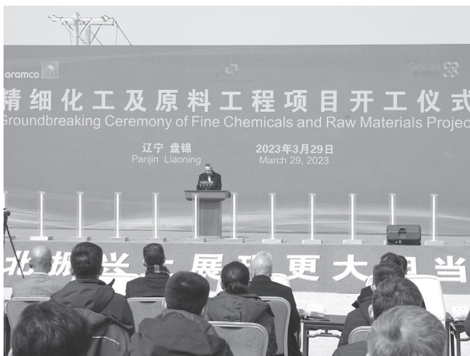
>> 2023年3月29日，华锦阿美石化有限公司精细化工及原料工程项目在辽宁盘锦破土动工。图为开工仪式现场

级。今年5月，宝武集团旗下宝钢股份与沙特阿美石油公司、沙特公共投资基金正式签约，共同在沙特建设全球首家绿色低碳全流程厚板工厂，这是宝钢在海外建设的首个全流程生产基地，将帮助沙特跻身高端钢铁生产国行列。