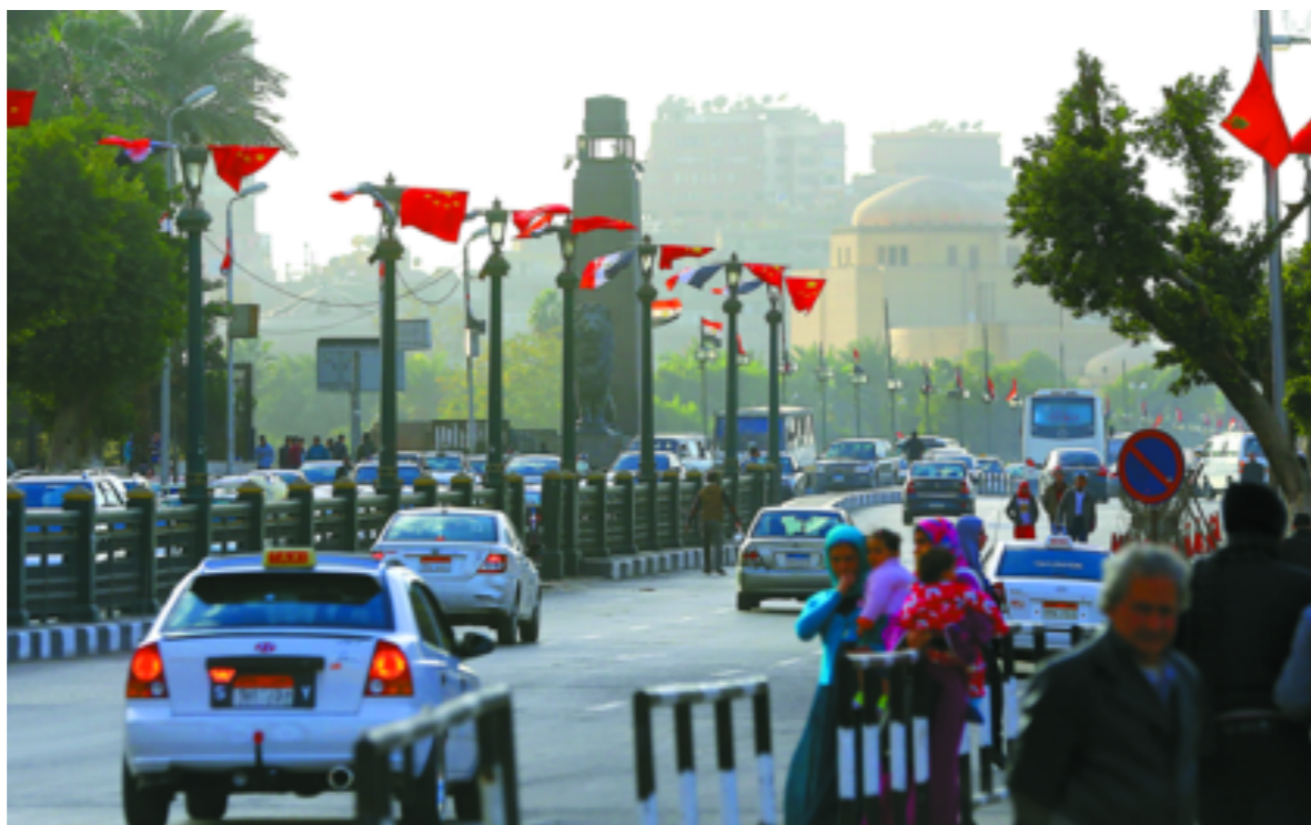
1月19日,中国国旗与埃及国旗悬挂在埃及开罗街头。为迎接中国国家主席习近平访问埃及,开罗主要街道悬挂上了中埃两国国旗。

在国内,塞西政府当务之急是发展经济,扩大就业,改善民生,稳定政局。为拉动经济,政府启动了三大工程:开凿新苏伊士运河,建新行政首都,开垦150万费田(约合63万公顷)农田。原定3年完成的新运河工程,在塞