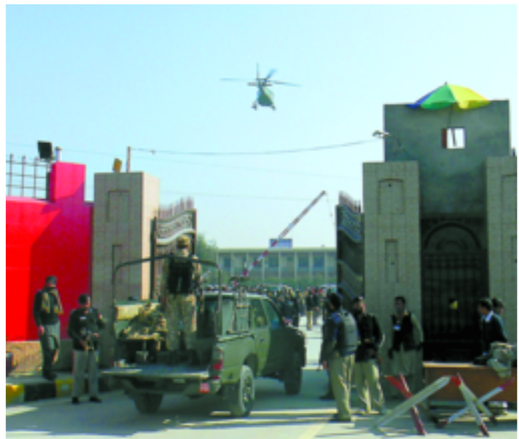
遇袭的帕夏汗大学位于贾尔瑟达地区,距离军事重镇白沙瓦大约50公里。警方说,武装人员当天上午趁浓雾翻墙进入校园,然后在学生宿舍等建筑内开枪射击。军队、警察和特种部队迅速包围校园,清剿袭击者。电视新闻画面显示,大批军车满载士兵进入校园,直升机在天空盘旋,救护车在校门外待命,许多家长在焦急等待。袭击发生后,老师要求学生立即疏散,一些人躲进厕所。目睹袭击的学生们说,袭击者持AK-47自动步枪。

新华社特稿 巴基斯坦西北部地区一所大学20日遭到武装人员袭击,造成至少19人死亡、50多人受伤。巴基斯坦塔利班宣称实施了此次袭击。