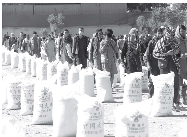
>> 2022年4月初，中国政府对阿富汗人道主义援助的第五批粮食运抵阿富汗。图为2022年4月23日，阿富汗民众在喀布尔领取中国援助的粮食

第一，确立阿富汗战后重建的基本政治原则。与会各方重申尊重阿富汗独立、主权和领土完整，