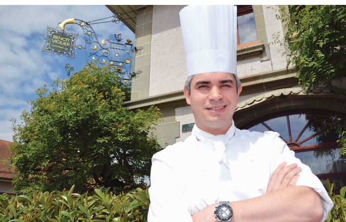
图为伯努瓦·维奥利耶生前在其餐厅前的留影。