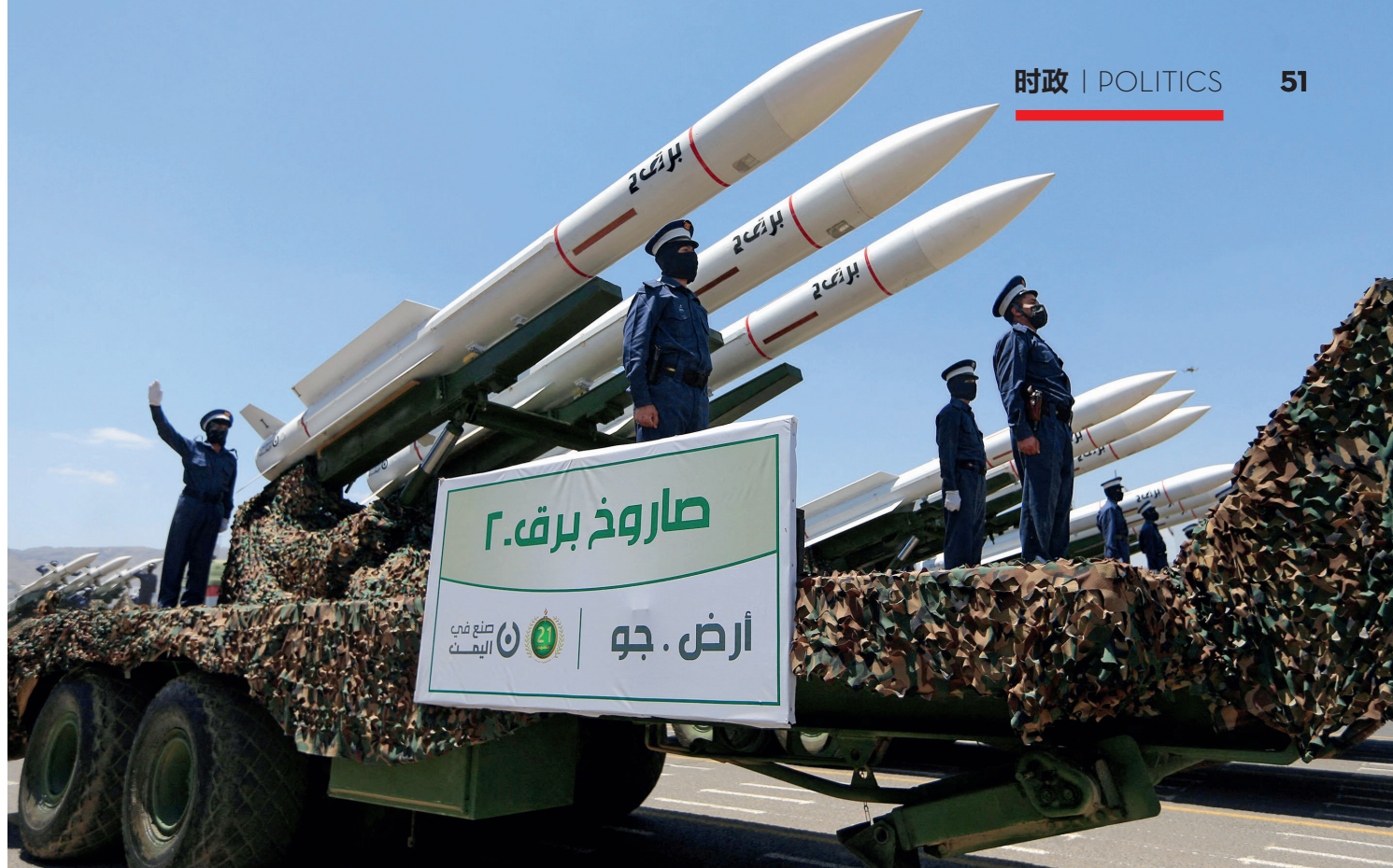
2023年9月21日，胡塞武装士兵在庆祝占领也门首都萨那9周年的官方阅兵式上庆祝。

府军的交战中被俘，而后被处决。为了纪念他，追随者们把“青年信仰者”组织改名“胡塞人”。由于这个组织已走上了武装斗争道路，所以国际上把它称为“胡塞武装”。