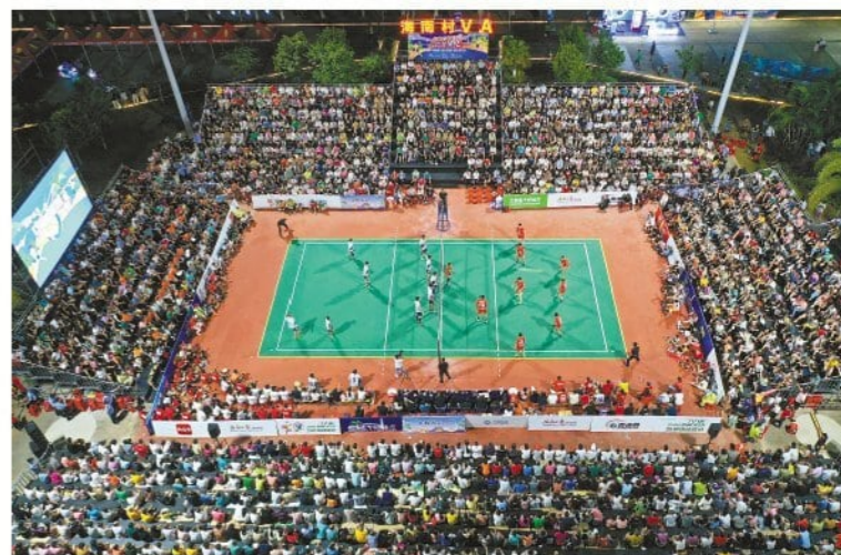
图为“村排”比赛现场（8月6日摄，无人机照）。

近日，被称为“村排”的海南九人制排球赛在海南文昌举行。比赛为期一个多月，共有来自海南省的20支镇男子排球队参赛。球员们来自各行各业，没有年龄限制。观众席场场爆满，锣鼓喧天，气氛火热。