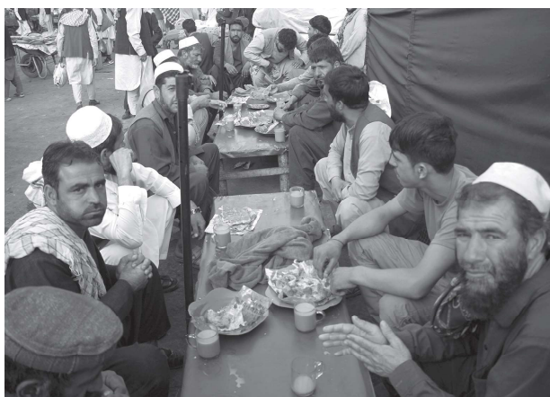
>> 阿富汗塔利班进入并控制首都喀布尔以来，当地经济状况持续恶化。图为2021年9月15日，阿富汗民众在喀布尔街头吃早餐

威的过程中，其政治包容性受到质疑。塔利班已经初步建立了伊斯兰政府，但其包容性并没有呈现出来，其内阁中没有女性，妇女需要在伊斯兰教原则范围内生活、学习、工作，过去所享有的权利正在减少。非普什图族以及前政府官员很少被纳入内阁，其政治代表性严重不足，究其原因在于塔利班担心建立一个包容性政府可能会削弱其绝对威望和内部凝聚力。对他们来说，更重要的是由有权势的人领导他们的政府，这样他们就可以压制潜在的抵抗运动。此外，他们还拒绝政